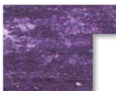
.../940 Viola Prugna