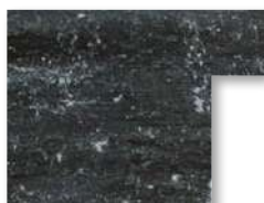
.../944 Nero Grafite