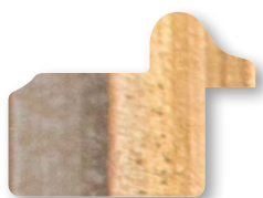
.../133 Grigio Filo Oro