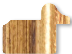
.../131 Oro Antico