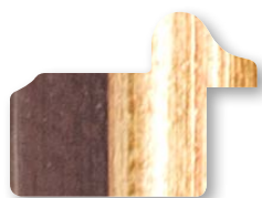
.../134 Marrone Filo Oro