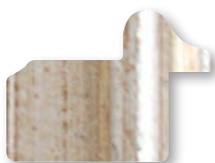
.../132 Argento Antico