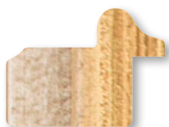
.../136 Avorio Filo oro