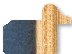
.../140 Blu Filo Oro