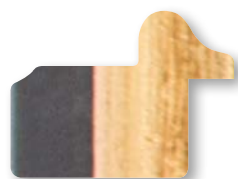
.../135 Nero Filo Oro