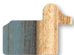
.../141 Azzurro Filo Oro