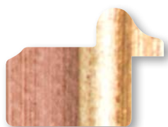
.../142 Rosa Filo Oro