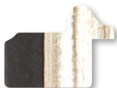
.../143 Nero Filo Argento