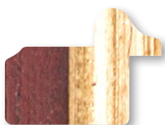
.../137 Rosso Filo Oro