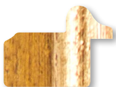
.../138 Senape Filo Oro