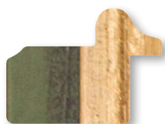
.../139 Verde Filo Oro