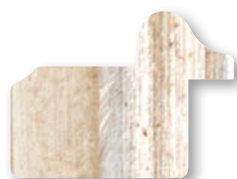
.../144 Avorio Filo Oro